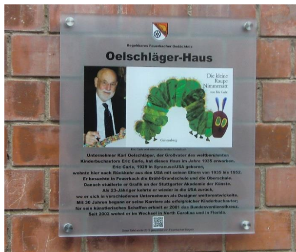
Beispiel einer Objekttafel (Kinderbuchautor Eric Carle)

Die Spender der Objekttafeln wurden auf den Tafeln selbst, aber auch in der BFG-Broschüre erwähnt.